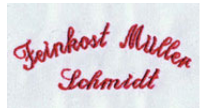
Schriftart 1 mit Bogen